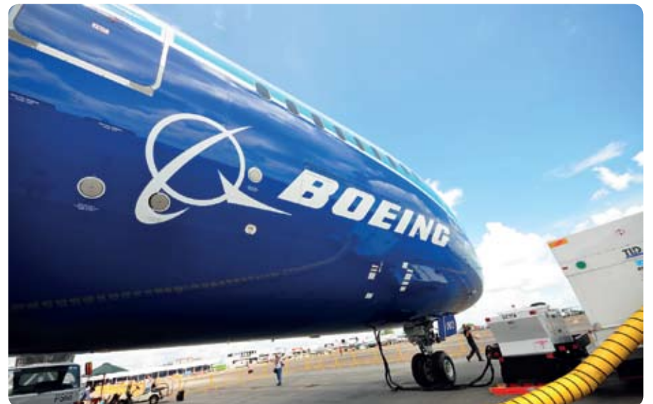
Gigante norte-americana está de olho no controle da Embraer