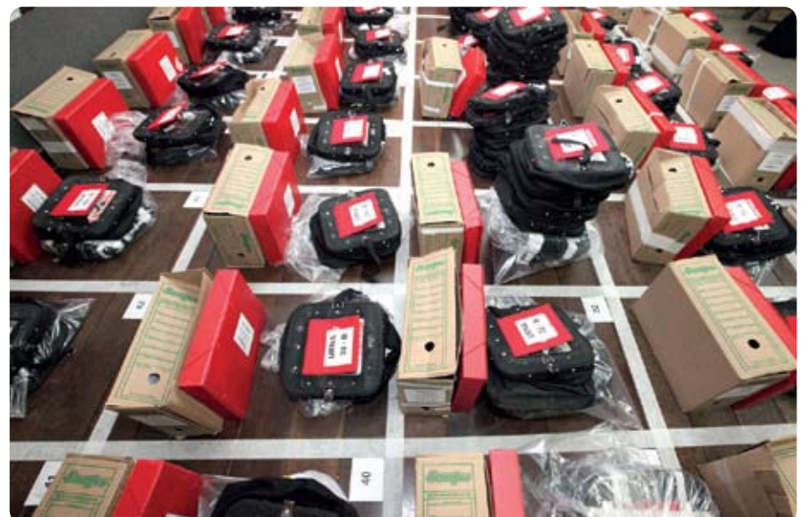
Na sede do Sindicato, organização das urnas usadas na eleição de 2015

Fique atento ao roteiro e participe da eleição.