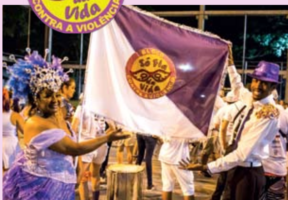
Bloco se formou em 2017 e faz críticas à opressão

Este ano, o samba do bloco Sô Fia da Vida é uma celebração ao amor e crítica à homofobia.