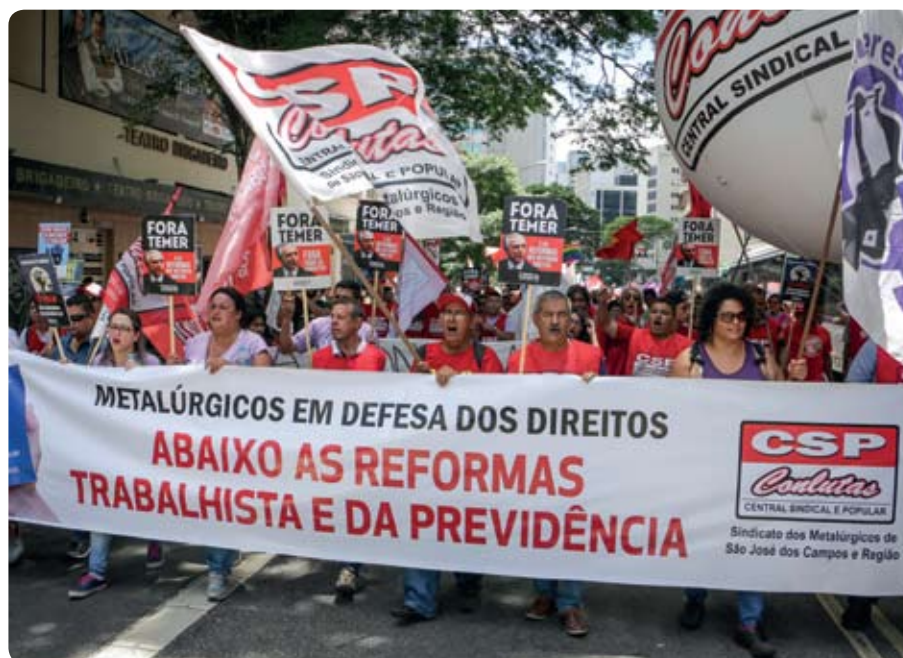
Dia Nacional de Lutas contra as reformas de Temer realizado em novembro de 2017

realizarão um Dia Nacional de Luta contra a reforma da Previdência.