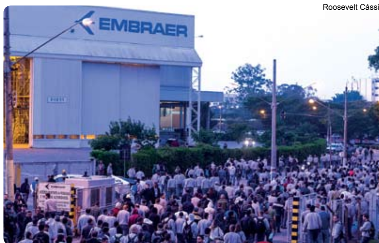
Trabalhadores receberam antecipação da PLR no dia 31