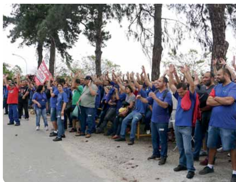
Os metalúrgicos da Parker Filtrros (acima) e TI Automotive (ao lado) se mobilizaram e garantiram direitos e aumento real