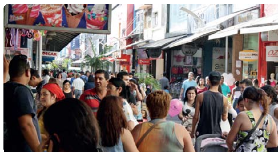
O comércio é fortemente beneficiado com o 13º dos trabalhadores