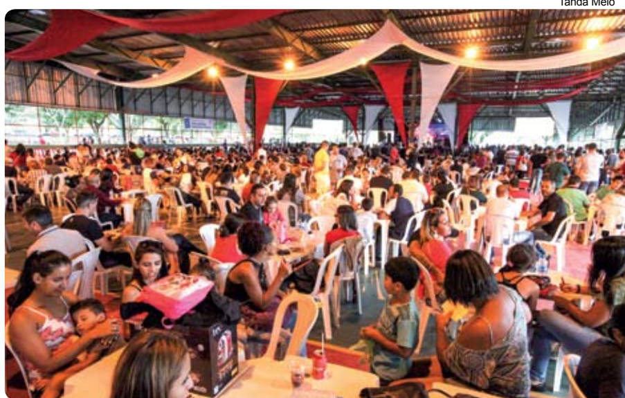
O Festival é momento de confraternização entre os metalúrgicos e familiares

Está chegando a hora dos trabalhadores se divertirem com a família no 51º Festival dos Metalúrgicos.