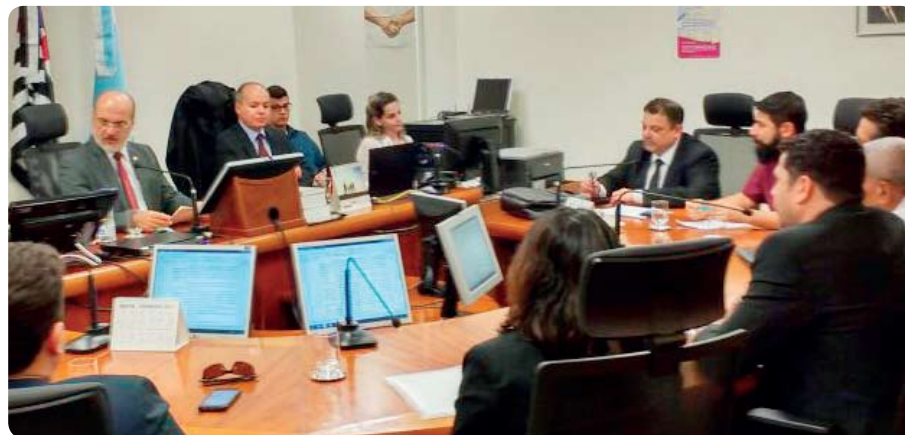
Audiência de conciliação no TRT discute reajuste salarial dos trabalhadores

Esse índice já foi rejeitado pelos trabalhadores da Embraer e de todo o setor aeronáutico.