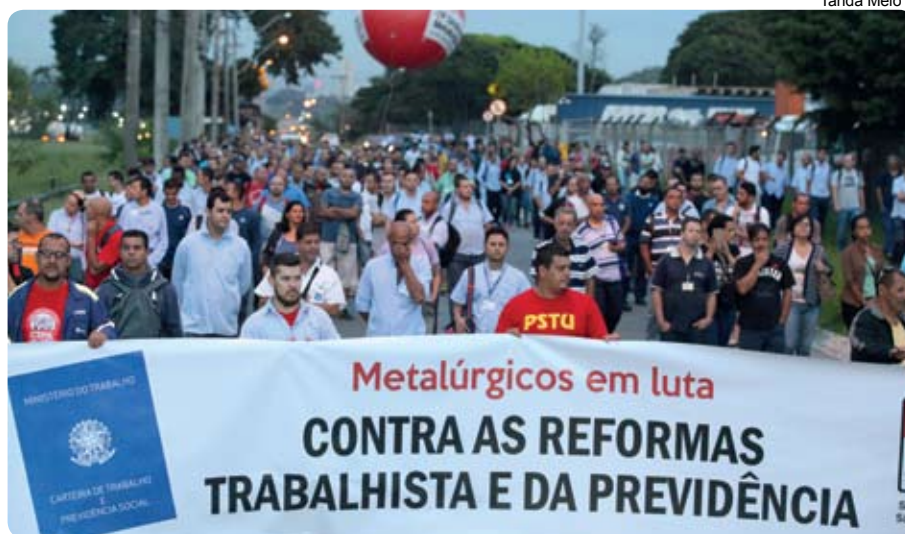
Trabalhadores da GM durante dia nacional de luta, em março

Depois da vitoriosa greve de 28 de abril, a CSP-Conlutas e o Sindicato defenderam uma nova paralisação de 48 horas, mas não houve consenso entre as centrais. Mesmo assim, agora é hora de