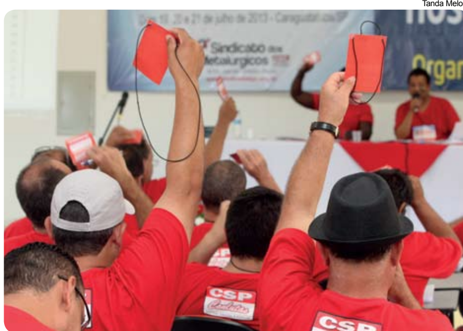
Delegados representam a categoria em votações no Congresso

Se você quer participar o 12º Congresso, procure um diretor sindical e ajude a fortalecer as lutas da categoria.