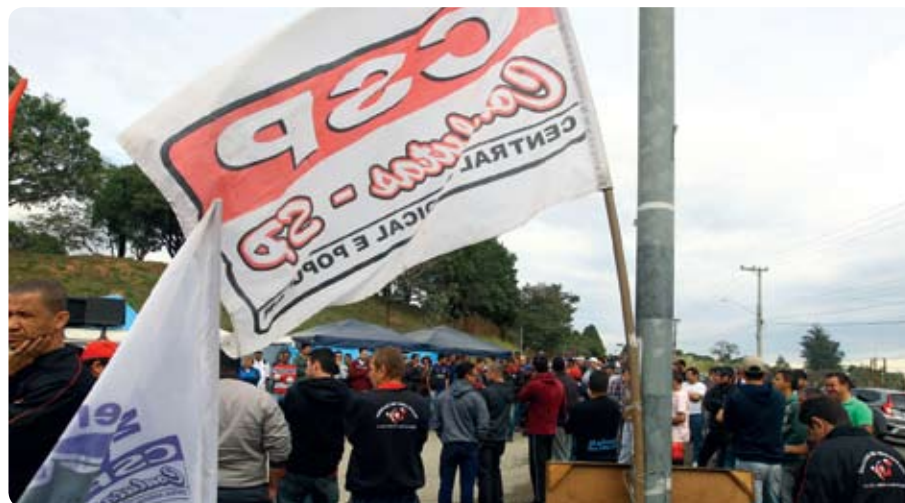
Luta por PLR vai esquentar nas fábricas da região

A luta por PLR (Participação nos Lucros e Resultados) vai ganhar mais força nos próximos dias, com os trabalhadores pressionando os patrões a avançarem nas negociações.