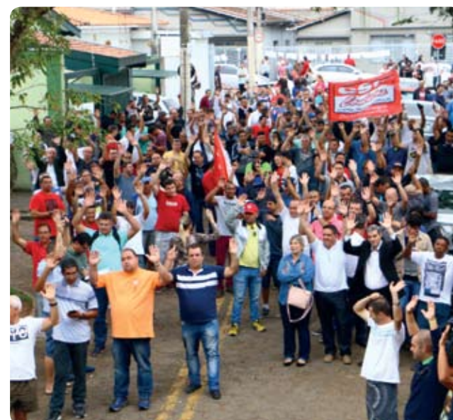
Ex-trabalhadores aprovam acordo negociado pelo Sindicato