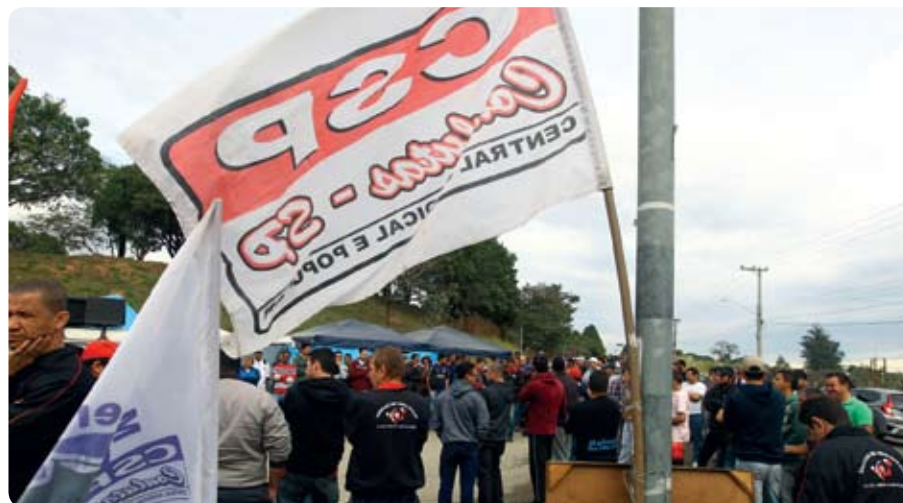
Luta por PLR vai esquentar nas fábricas da região

A luta por PLR (Participação nos Lucros e Resultados) vai ganhar mais força nos próximos dias, com os trabalhadores pressionando os patrões a avançarem nas negociações.