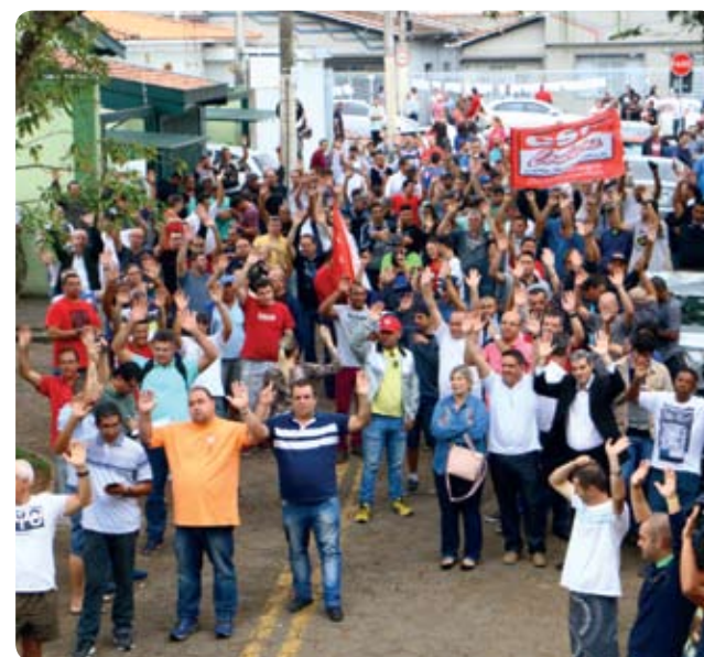
Ex-trabalhadores aprovam acordo negociado pelo Sindicato