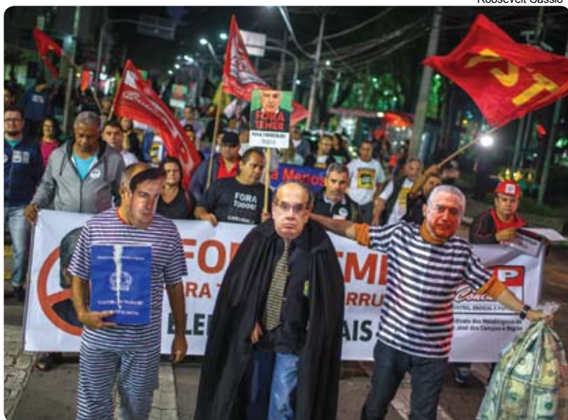
Protesto realizado em São José, nesta terça (6), exige "Fora Temer"

No dia em que começou o julgamento da chapa Dilma/Temer pelo Tribunal Superior Eleitoral (TSE), nesta terça-feira (6), sindicatos e movimentos sociais ligados ao Fórum de Lutas do Vale do Paraíba foram à Praça Afonso Pena, em São José dos Campos, exigir "Fora Temer".